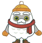
シルバー人材センター事業 マスコットキャラクター「チーフクロー」